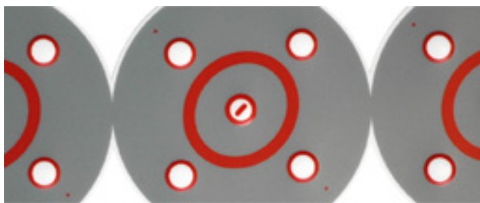
Abb.: Ausschnitt bedruckte Folie

Die Bedruckung mit klaren Fensterlacken auf der Dekoroberfläche kann mittels UV-Lacken erfolgen. Dabei werden Sichtfenster mit außergewöhnlich hoher Lichtdurchlässigkeit, Klarheit und ruhiger Lackoberfläche erzielt – eine gute Ablesbarkeit von Displays und LED-Anzeigen ist gegeben. Die Brillanz von Siebdruckfarben ist sehr hoch und die Randschärfe gedruckter Linien und Symbole sehr gut. Des Weiteren ist eine Nachhärtung der Folie nicht notwendig, ggf. erhöht sich dadurch die Chemikalienbeständigkeit.