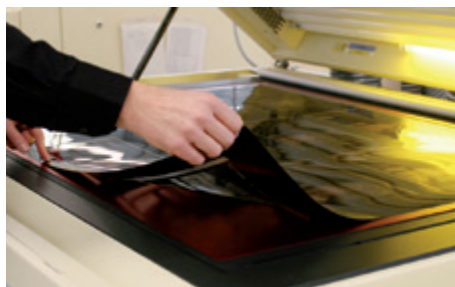
Der LADF kann ohne vorherige Reinigung verwendet werden