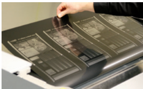
Bebildung mit IR-Laser