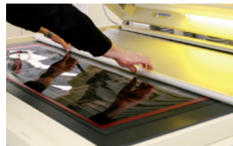
Präzise Reproduktion auf die Druckplatte